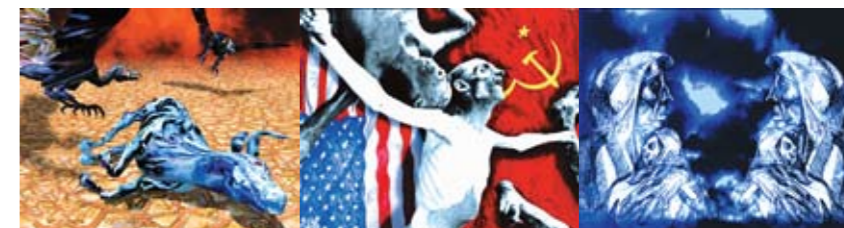
Perón, Sinfonía del Sentimiento , de Leonardo Favio: um relato impossível. Perón, Sinfonía del Sentimiento , by Leonardo Favio: an impossible story.

Terminadas as promessas modernistas, esta primeira década do terceiro milênio demonstra que as dificuldades na produção artística continuarão sendo iguais ou piores que na década de 1930. O que nos remete a dois países ricos, com uma má distribuição da riqueza, dependentes de um poder predador globalizado, cujos orçamentos em cultura e produção artística audiovisual são pouco significativos. Mesmo que a Argentina e o Brasil tenham uma produção quantitativamente interessante, pouco vista por seu público. No caso de mercados pequenos como o argentino, praticamente todos os filmes dão prejuízo, não recuperando, fora contadas exceções, os custos de sua produção. Por isso é sempre preciso obter um crédito ou subsídio do Instituto Nacional de Cinematografía y Artes Audiovisuales, o que implica longos processos de espera, influências e negociações. Peixoto, com pouco mais de 20 anos, conseguiu realizar seu primeiro filme, um dos mais importantes da história do cinema do continente, porém sem nunca mais poder fazer outro. Mesmo que isso não tenha sido causado por problemas econômicos, essa é