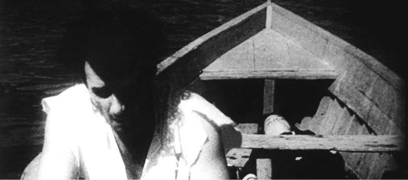
Limite (1931), de Mário Peixoto: a deriva como metáfora. Mário Peixoto's Limite (1931), drifting as metaphor.