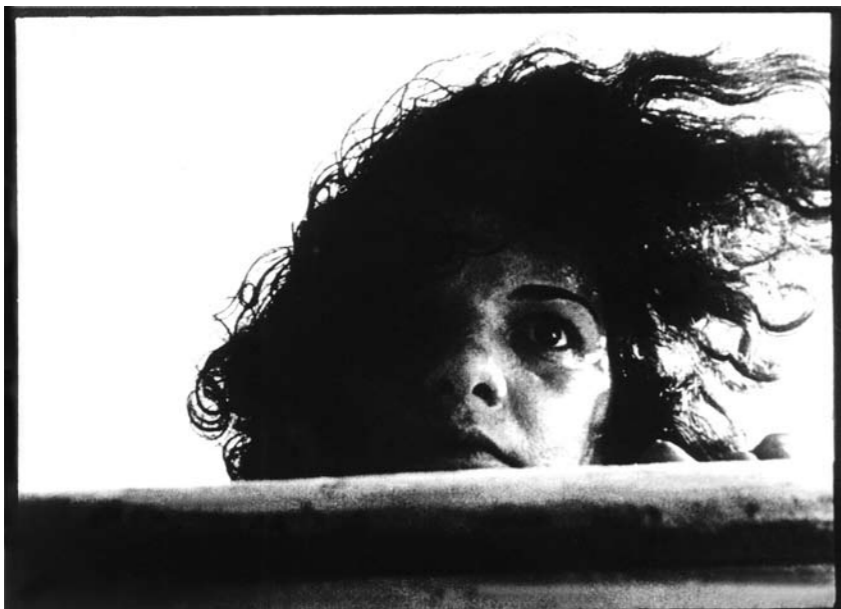
Na construção de um espaço fílmico não-linear, Limite (1931), de Mário Peixoto, antecipa e inaugura a experimentação da imagem contemporânea. In building non-linear filmic space Limite (1931), by Mário Peixoto, augurs and inaugurates the experimentation of the contemporary image.