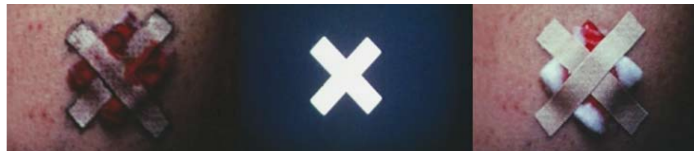
Stills do filme The Illustration of Art I (1971), de Antonio Dias, da série composta de trabalhos em papel, pinturas, objetos, publicações, instalações e filmes em super-8. Stills from Antonio Dias' film The Illustration of Art I (1971), from the series comprising works on paper, paintings, objects, publications, installations, and Super-8 films.

Os filmes radicais de Bressane remeteriam ao conceito de mitopoética ( Dog Star Man , Brakhage, 1961-1964) ou ao que preferi chamar de cinema-paideuma 14 .