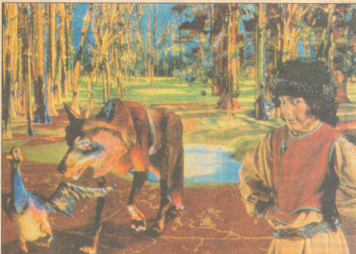
O vídeo 'Pedro e o Lobo', de Michel Jaffrennou: projeto de US$ 6 milhões tem pintura e animação