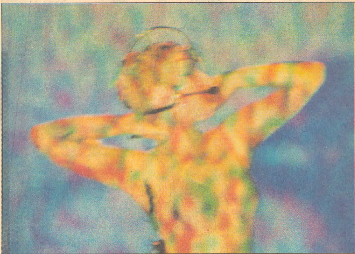
Gema da performance 'Le Partage des Peaux 2', da canadense Isabelle Choimière: dança eletrônica