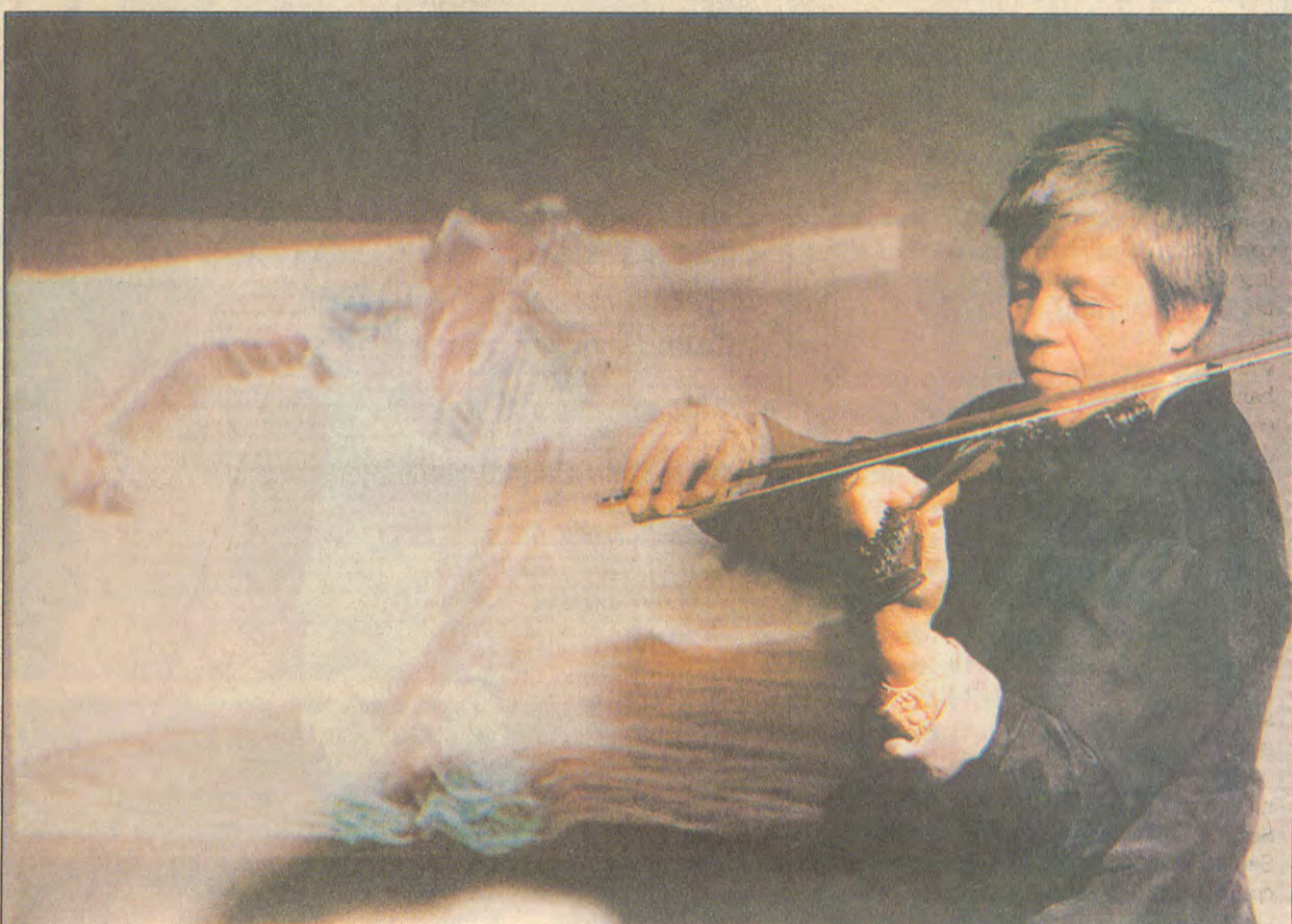
A violinista Steina Vasulka faz performance no Videobrasil: homenagem ao mestre Nam June Paik