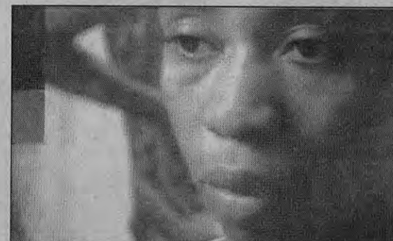
Cena do vídeo 'Vada': co-produção entre Inglaterra, Angola e Brasil