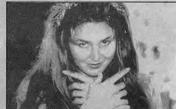
Cena de 'Infiniteum': filme australiano da videomaker Lisa Alexander