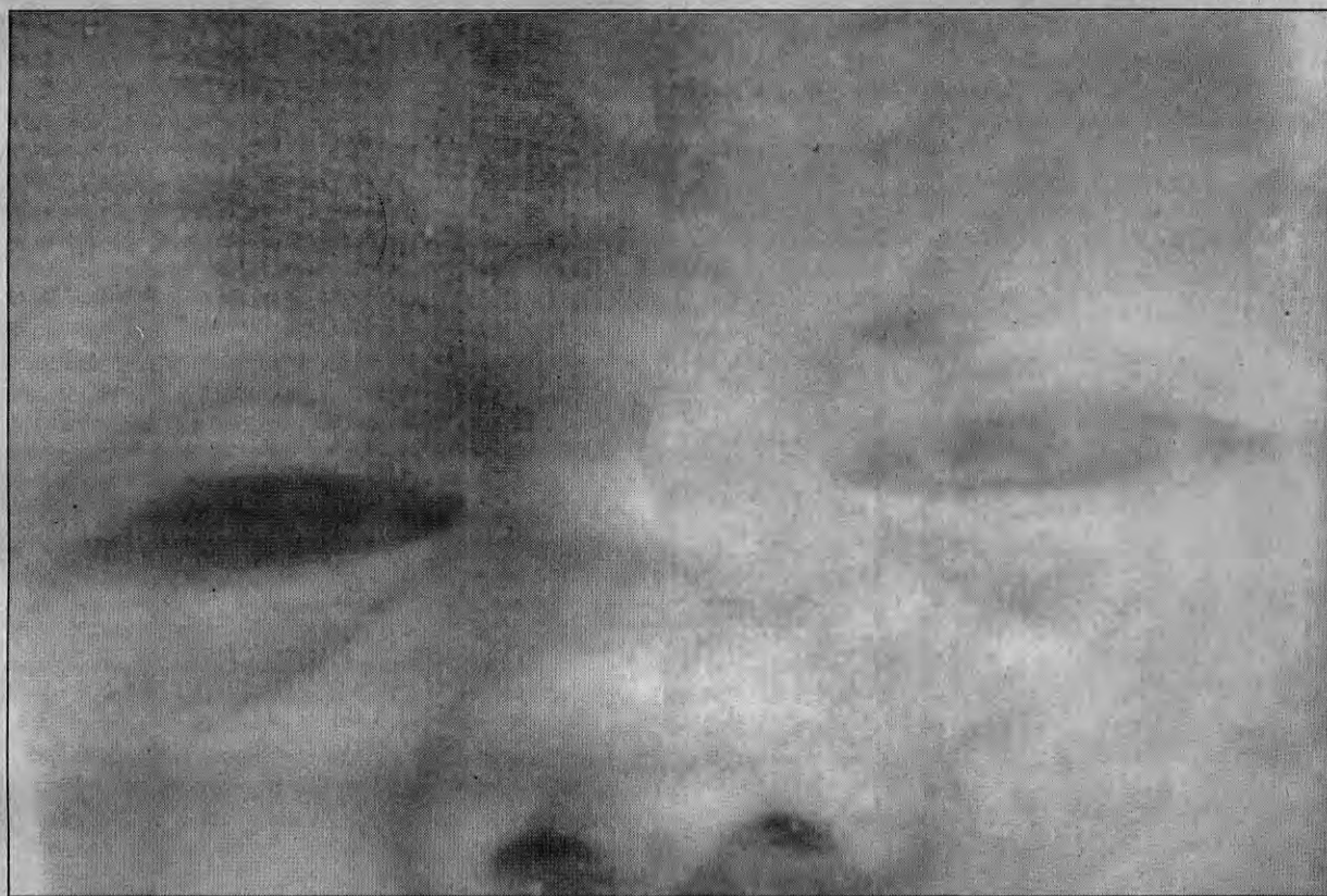
'Trovoada', de Carlos Nader, premiado pela ZKM da Alemanha: dinheiro e gravações na Europa

Essa sensação causou comentários de várias pessoas sobre a idéia de tempo. Em vez de ter procurado os protagonistas, Nader fez um esforço para não ir atrás deles. São relatos de personalidades que ele encontrou